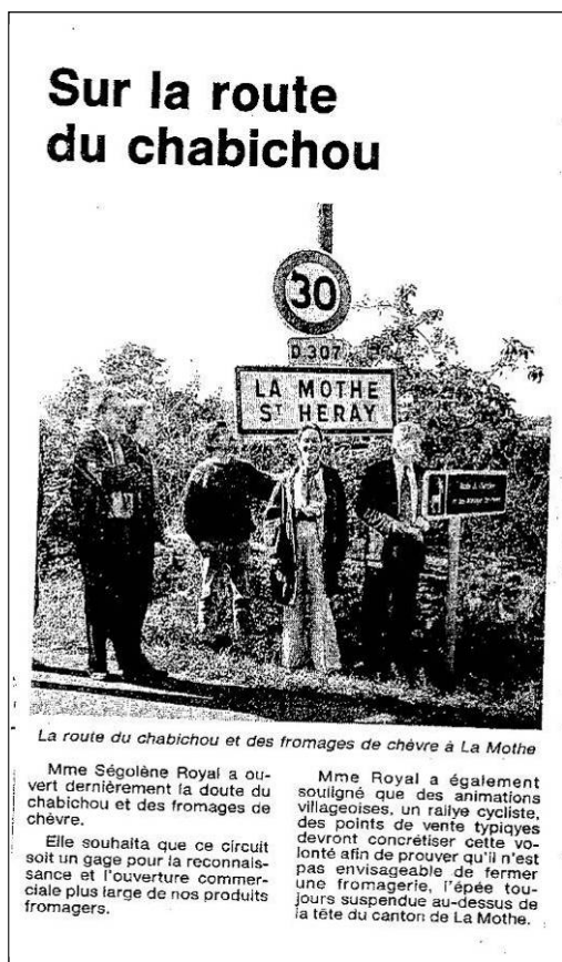
Figure 1: identification des adhérents de la Route du Chabichou et des Fromages de chèvres

La Route naît alors dans ces deux pays: le Pays Mellois et le Pays du Haut Val de Sèvre. Tous les acteurs au demeurant sont présents à la constitution de l'association, à savoir :