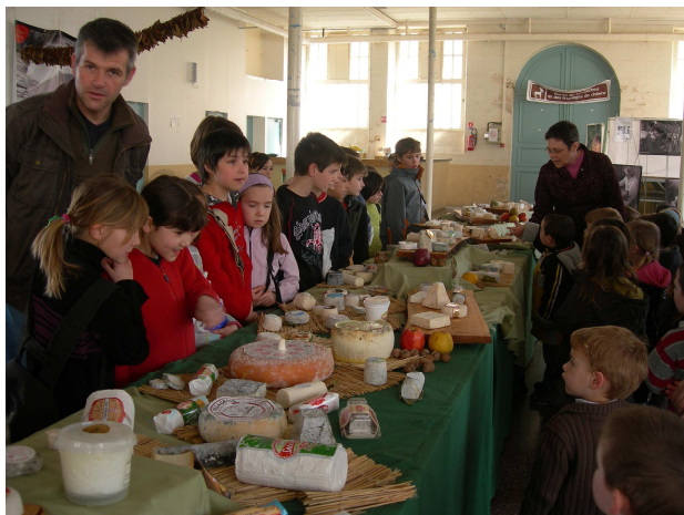
Figure 7: : Les écoles de la Mothe Saint Héray au Grand plateau de fromage de chèvre. Semaine des fromages 2008

Si elles restent fidèles au projet initial, il est vital de réinterroger ce projet qui est le plus souvent discuté en terme de « chiffre »: nombre d'animation, quantité de public touché, diversité géographique, articles de presse...autant d'indicateurs révélateurs du dynamisme de l'association mais qui ne doivent pas masquer les véritables enjeux, y compris quand ces enjeux/effets ne sont pas totalement perçus, intégrés par les acteurs d'origine. L'élargissement de la Route doit être l'occasion de reposer un projet partagé et collectif, de réfléchir à son « autonomie » ou « dépendance » financière. Quid de toutes ces actions sans moyens financiers? Qui pour les porter? Quelles motivations sont le ciment de ces adhérents qui constituent les haltes?