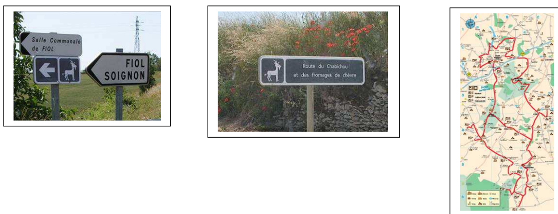
Figure 2: identification des adhérents de la Route du Chabichou et des Fromages de chèvres

L'accueil dans les lieux de productions est donc bien au centre de la construction de la Route en ces premières années, (la mobilisation des moyens financiers en témoigne). Le public recherché va de l'habitant du territoire, aux vacanciers et aux autocaristes. De sa double vocation, professionnelle et touristique, la Route emprunte au secteur touristique ses méthodes de prospection et d'analyses (remplir les statistiques de fréquentation de chaque site par exemple pour évaluer l'impact de la Route fut toujours difficile - les producteurs sont souvent fâchés avec « les papiers »! - mais faisait partie d'une restitution à chaque AG