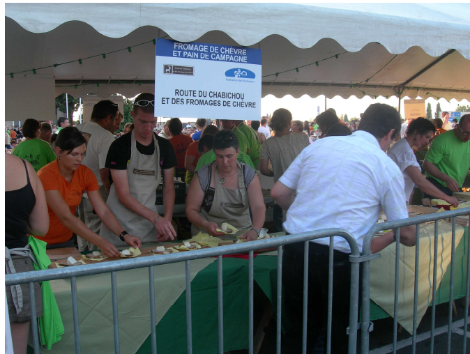
Figure 11 : La Route aux Grandes Tablées de Saumur en 2009

Par ailleurs la Route propose dégustation et découverte des produits caprins dans de multiples lieux touristiques qui servent de support aux festivals et animations (Les Nuits Romanes à Melle, Fontevraud, repas caprin au Tumulus de Bougon, par ex) Elle accompagne également le Comité Régional du Tourisme dans des salons nationaux (Rennes en 2009) et dans les capitales européennes.