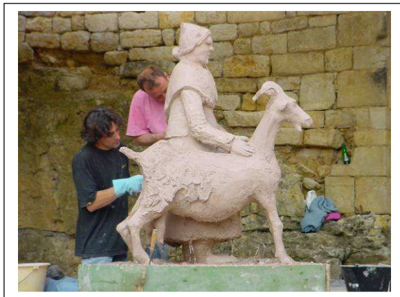
Figure 10 : oeuvre artistique réalisée à l'occasion de la Fête de la Chèvre à Celles Sur Belle (79) en 2007 et de la Fête de la Chèvre à Melle (79) en 2002