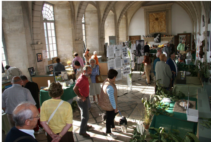
Figure 13 : Exposition muséographique à la Fête de Celles sur Belle en 2007

Même si la Route a été pressentie pour devenir le porteur financier du projet et assurer l'animation de ce lieu collectif, c'est finalement une nouvelle association, en cours de constitution, qui portera ce projet de « Maison du Fromage de Chèvre ». La Route en sera toutefois membre...avec tous les acteurs de la filière (Brilac, ACLC, Syndicats de défense du Chabichou, Mothais sur Feuille et chèvre boîte, FRESYCA,...) collectivités locales, acteurs du tourisme... Une configuration qui ressemble à s'y méprendre à celle de la Route !