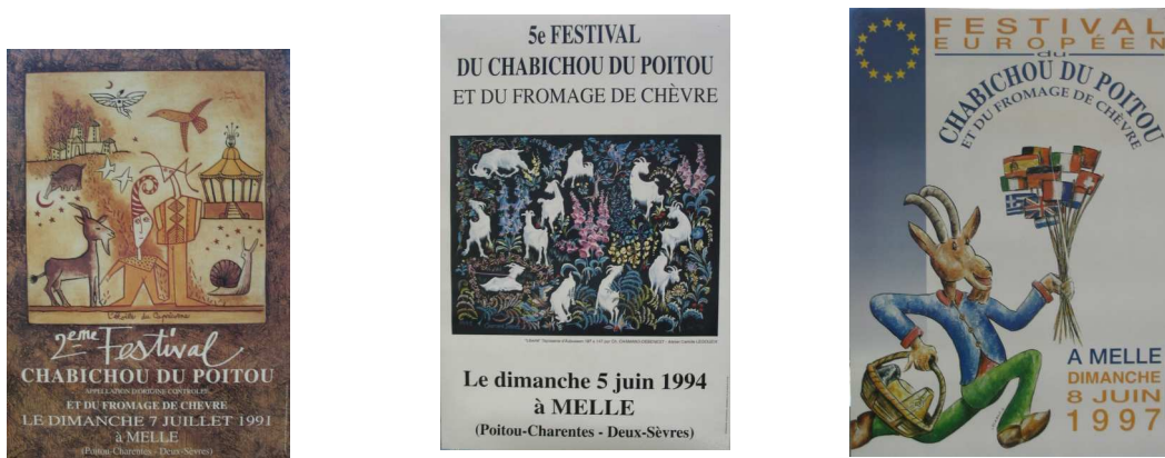
Figure 3: exemple d'affiches du Festival du Chabichou

En 1999, les Amis du Chabichou passe le relais à la Route dans des conditions difficiles: la municipalité de Melle, important partenaire (mise à disposition humaine et matérielle, financière) annonce son intention d'organiser ce festival tous les deux ans (elle est sollicitée par d'autres associations du Mellois). La filière « officielle » montre les premiers signes d'abandon de son soutien, officialisée en 2001: l'Association Centrale des Laiteries Coopératives (ACLC) décide de ne plus participer au Festival du Chabichou « privilégiant d'autres modes de promotion »...dont acte!