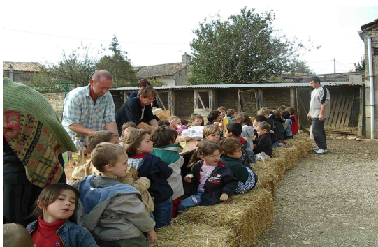
Figure 6 : Accueil d'écoles dans les haltes de la Route du Chabichou

On constate une forte diminution des visites d'élevage, liée en partie aux contraintes budgétaires et réglementaires des établissements scolaires. Par contre les interventions en classe se multiplient sans qu'elles soient par ailleurs prises en charge par les producteurs eux-mêmes qui délèguent aux salariés de l'association. La présentation et la dégustation des fromages dans les selfs restent toutefois un temps de partage fort entre les producteurs eux-mêmes et les jeunes. Il est paradoxal de constater que la Route qui avait comme première ambition l'accueil dans les lieux de productions, pourrait voir cette fonction passer en second plan.