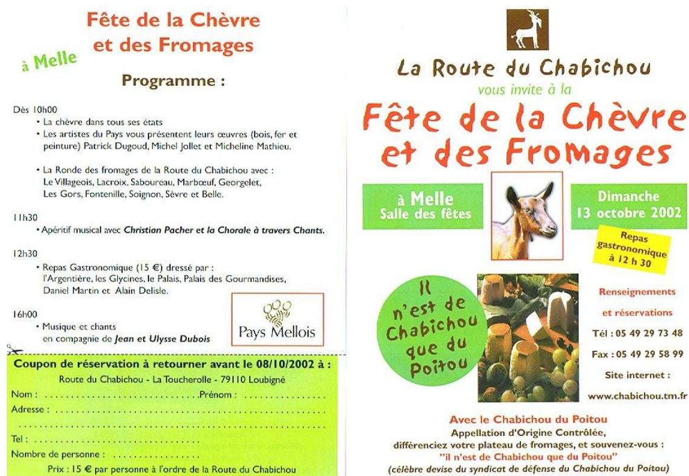
Figure 4: programme de la Fête de la Chèvre 2002 à Melle

En 2002, la Route organise la Fête de la Chèvre à Melle pour renouer avec la tradition du Festival du Chabichou. Elle s'engage à préparer cette manifestation tous les deux ans dans une ville différente pour réunir et fédérer tous les acteurs du territoire.