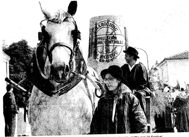
« Sa Majesté Chabichou, far de lance des produits de notre terroir, s'offre son V e Festival.