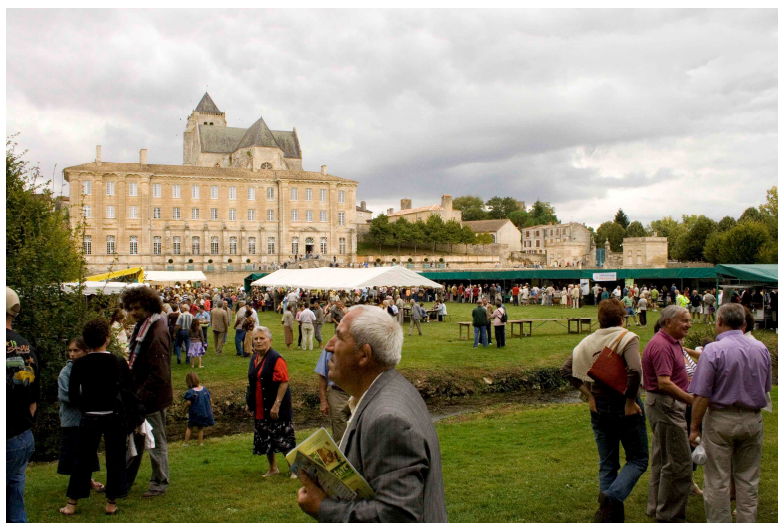
Figure 5: photographie Fête de la Chèvre 2007 à Celles sur Belle

Depuis son élargissement en 2007 à l'ensemble du territoire de la Région Poitou-Charentes, il lui reste à trouver les ressources nécessaires pour réussir ce même ancrage dans les territoires de ses nouveaux adhérents.